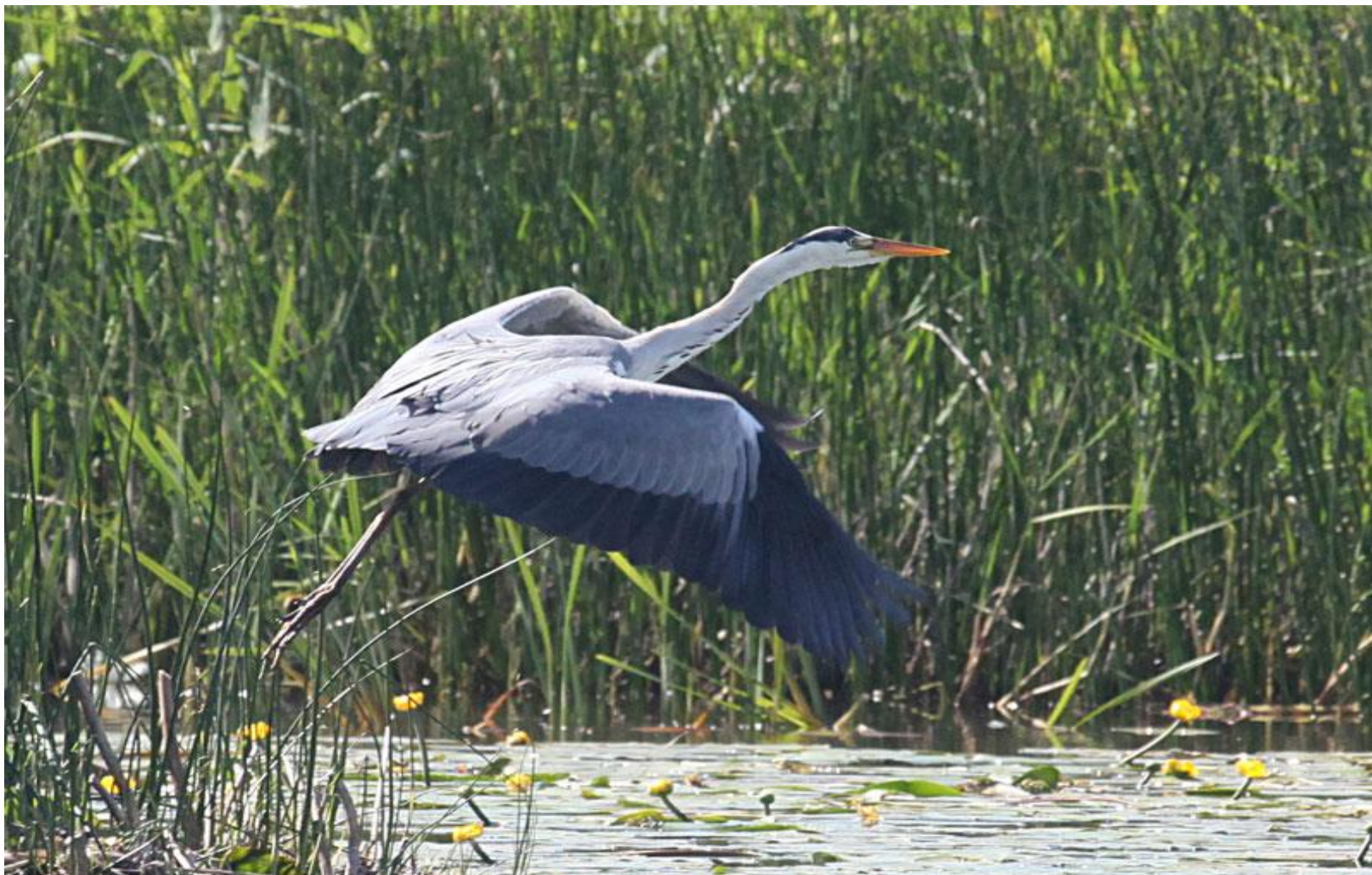
Zivju gārnis ( Ardea cinerea )