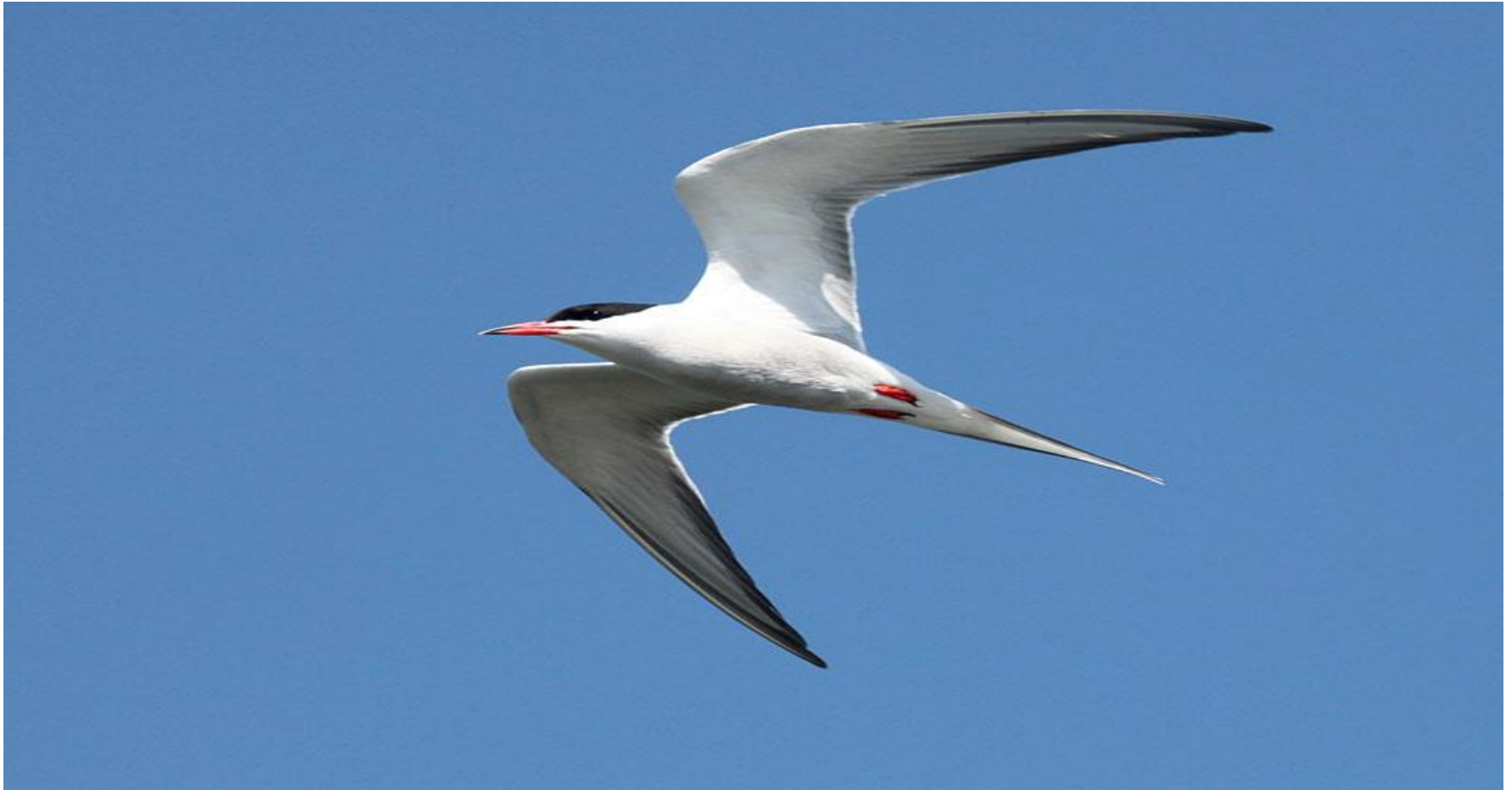
Upes zīriņš ( Sterna hirundo )