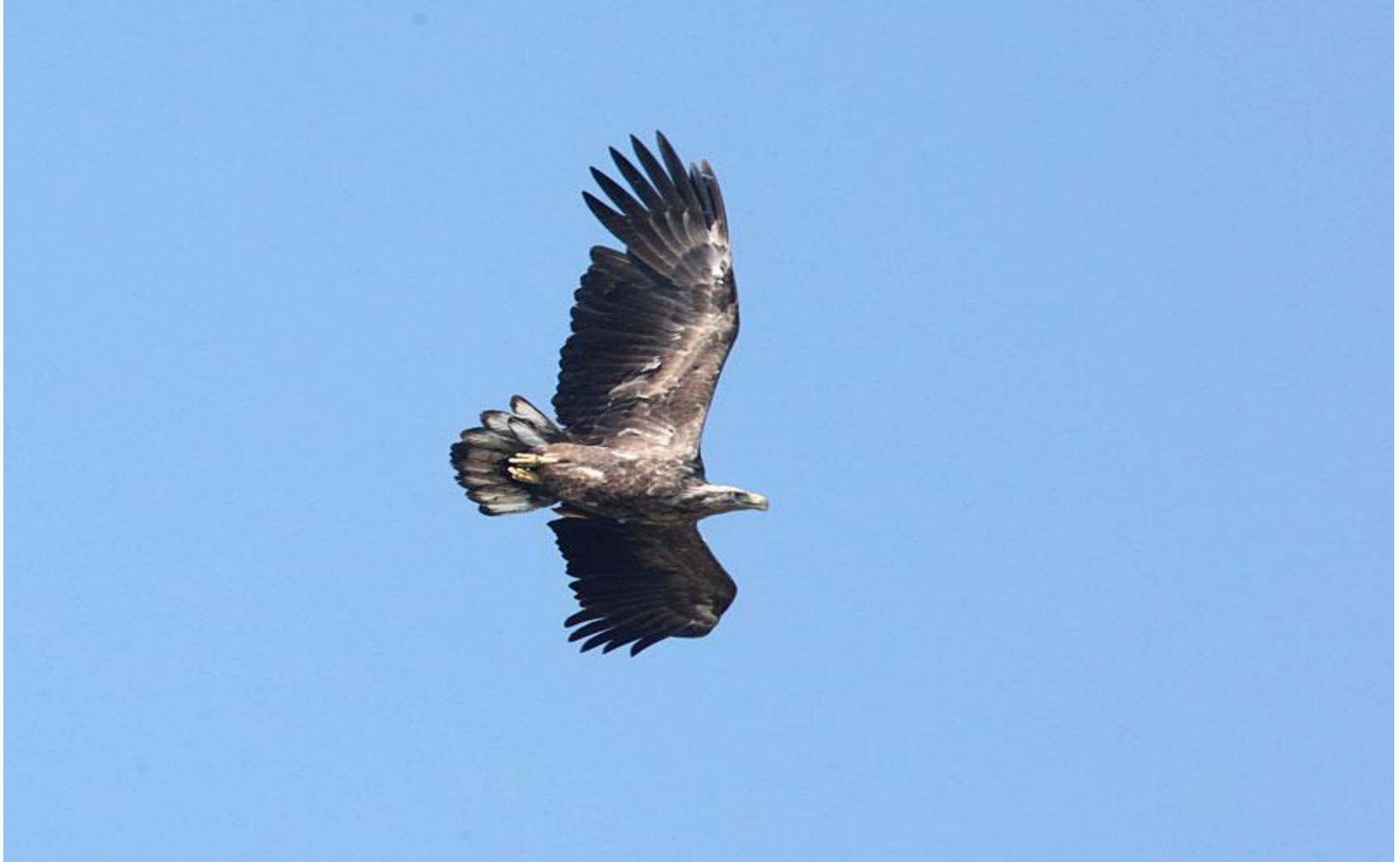
Jūras ērglis ( Haliaeetus albicilla )